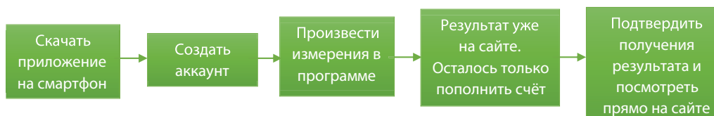
Рис. 4. Схема работы с приложением от установки до получения результата

То есть от скачивания приложения до получения результата — всего 5 простых шагов (рис. 4).