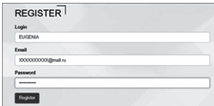
Рис. 1. Регистрация

При этом будет создан личный кабинет (рис. 2) на сайте vibrabrain.com, в котором можно следить за состоянием счёта, расходами баланса, а также просматривать результаты измерений как уже оплаченные, так и те, которые были получены, но не оплачены и пока скрыты от пользователя.